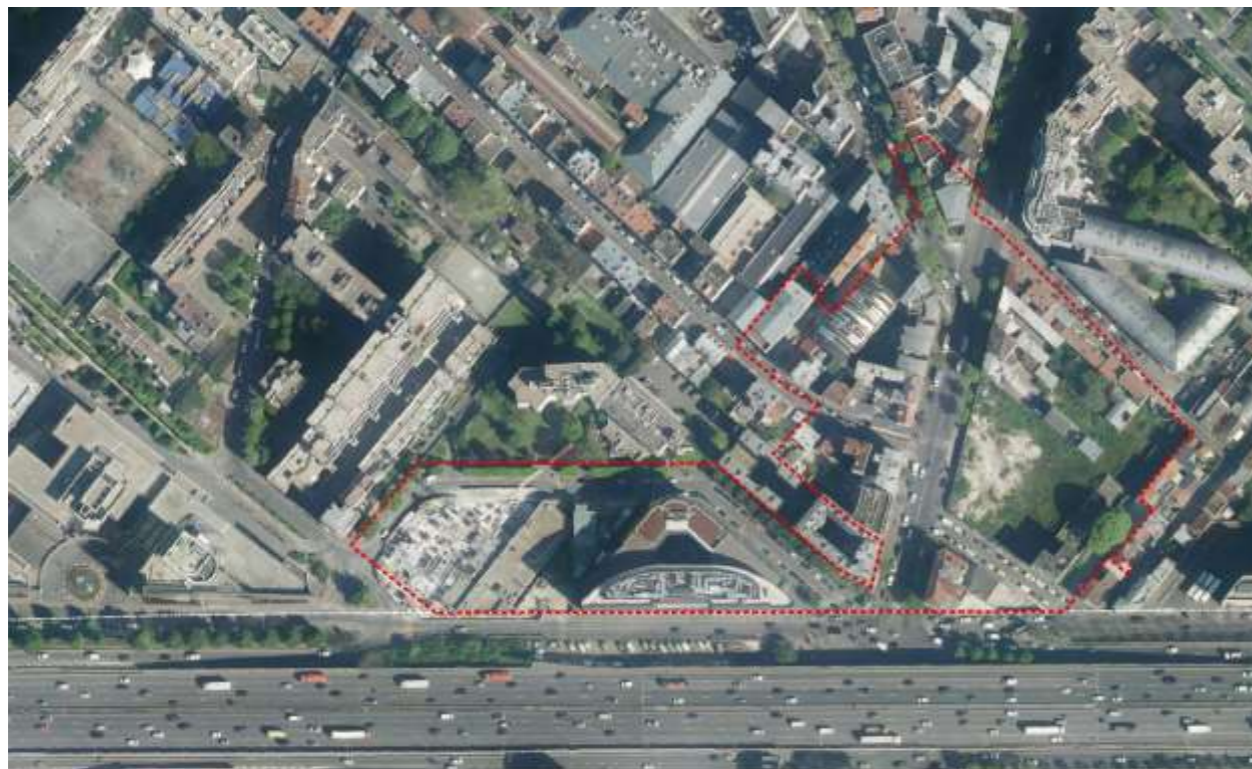
Porte de Saint-Ouen, vue satellite et périmètre de l'OAP