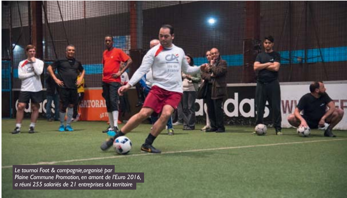
Le tournoi Foot & compagnie, organisé par Plaine Commune Promotion, en amont de l'Euro 2016, a réuni 255 salariés de 21 entreprises du territoire

Commune sont venus nous trouver pour demander un soutien financier pour la fan-zone, je n'ai pas beaucoup hésité. Dans tous les cas nous jouons à fond le jeu de l'intégration au territoire dans tous les domaines : sport, culture, formation. Et l'Euro 2016 c'est une formidable opportunité de développement pour Plaine Commune. »