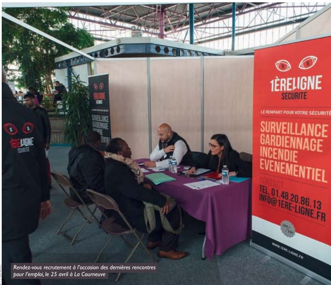
Rendez-vous recrutement à l'occasion des dernières rencontres pour l'emploi, le 25 avril à La Courneuve

La direction de l'emploi et de l'insertion de Plaine Commune a anticipé de longue date l'opportunité que pouvait représenter l'Euro. Formations qualifiantes et sessions de recrutement ont été organisées, en particulier dans le secteur de la sécurité.