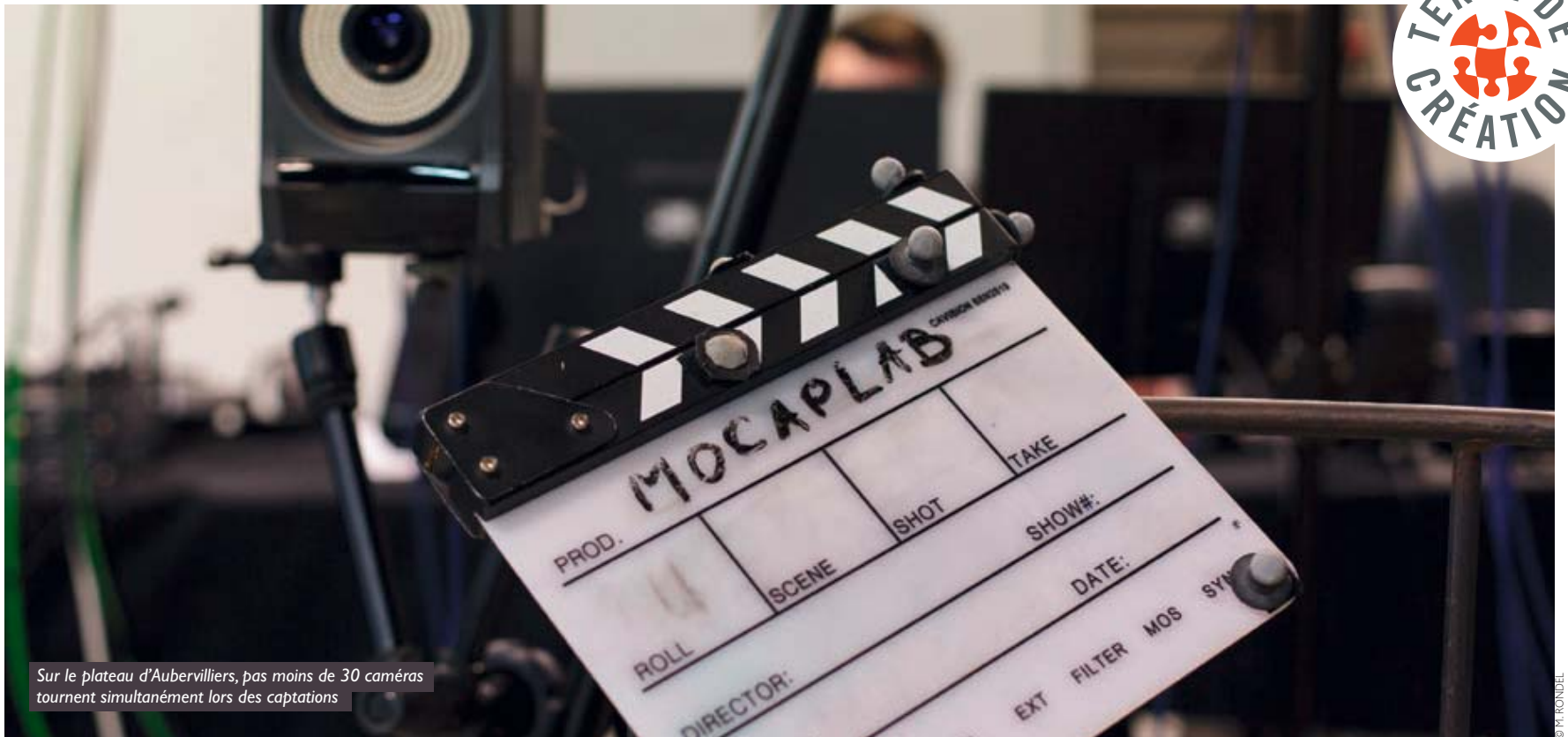
Sur le plateau d'Aubervilliers, pas moins de 30 caméras tournent simultanément lors des captations