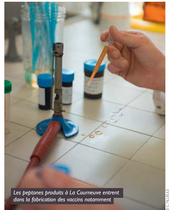
Les peptones produits à La Courneuve entrent dans la fabrication des vaccins notamment

Il est temps de visiter cette usine de 7 000 m 2 où travaillent au total 40 personnes. L'occasion idéale pour assister en direct à la fabrication des fameuses peptones ! Tout commence dans la partie « hydrolyse » : dans les grosses cuves sont mélangées les protéines végétales et les enzymes. Ça sent très fort le soja ! L'étape suivante est la filtration. Casimir Delors, doyen de l'entreprise avec ses 40 ans de bons et loyaux services, pousse une benne fumante : « Ce sont des gâteaux de filtration, des protéines non solubles, c'est-à-dire tout ce que les enzymes n'ont pas parfaitement découpé », ajoute le chef d'atelier. Des résidus particulièrement appréciés des agriculteurs qui s'en servent pour régénérer leurs terres. Un