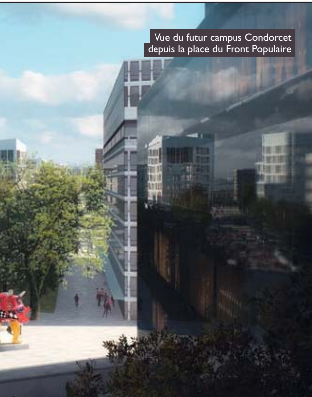
Vue du futur campus Condorcet depuis la place du Front Populaire

et de développement formidable qui contribuera à l'activité, à l'animation, à l'attractivité et au renouvellement des identités urbaines du territoire. » Du côté de la place du Front populaire, le futur est en marche et l'avenir d'Aubervilliers et des sciences humaines et sociales s'annonce radieux.