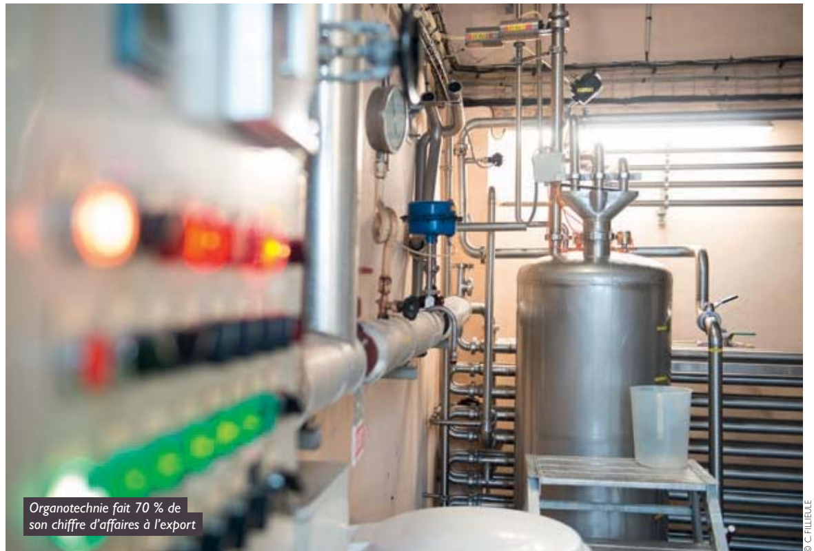
Organotechnie fait 70 % de son chiffre d'affaires à l'export

« La culture cellulaire est l'avenir de notre métier car c'est l'une des grandes évolutions du marché pharmaceutique. Ce que les gens ne savent pas c'est que les nouveaux médicaments de thérapie génique, qui consistent à traiter une maladie en introduisant un gène, ne sont pas fabriqués à partir de bactéries de micro-organismes mais à partir de cellules d'origine humaine ou animale. Contrairement aux bactéries, ces cellules n'ont pas de système immunitaire et sont donc beaucoup plus fragiles. Les biotechnologies nous poussent donc à produire et fournir des peptones d'une pureté irréprochable, la moindre toxine risquant de tuer les cellules. C'est un challenge particulièrement intéressant à relever ».