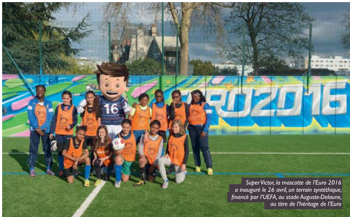
Super Victor, la mascotte de l'Euro 2016 a inauguré le 26 avril, un terrain synthétique, financé par l'UEFA, au stade Auguste-Delaune, au titre de l'héritage de l'Euro

221 millions d'€ l'impact économique territorial estimé pour Saint-Denis par le Centre de droit et d'économie du sport de Limoges